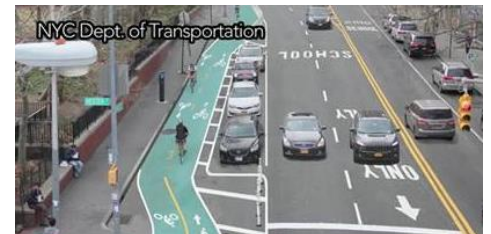
Chrystie St - NUEVA YORK

Crear una RED básica a través de carriles bici de uso exclusivo, fundamentalmente por calles principales, es imprescindible si queremos promover e integrar la bici en nuestra ciudad. Hay que ofrecer y facilitar que personas de cualquier edad y capacidad puedan desplazarse de forma segura en bicicleta. Así lo han hecho ciudades de gran tradición ciclista como Ámsterdam, Copenhague o Utrecht y lo están haciendo otras donde hasta ahora el uso de la bici era minoritario: Londres o Nueva York.